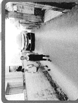
道幅がせまくてキケン 迂回のご協力をお願いします